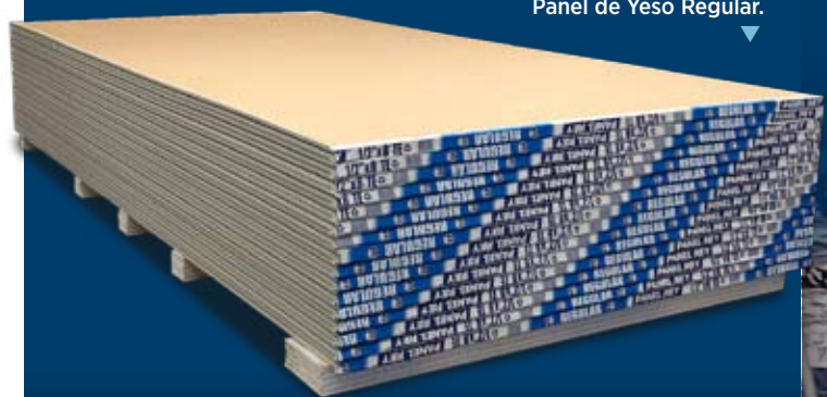
Panel de Yeso Regular.